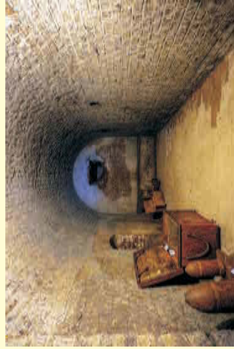
Blick in eine Pulverkammer