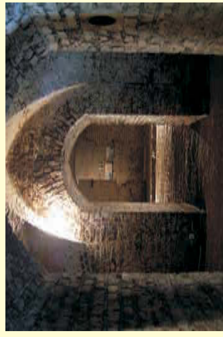
Blickkache durch die letzte erhaltene Kaponniere in Köln