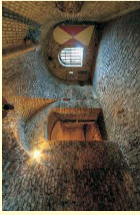
Selbst Tageslicht hat wenig Chancen einzudringen

Wer mehr erfahren möchte ist herzlich eingeladen! Die Öffnungszeiten sind auf der Rückseite abgedruckt – und gearbeitet wird regelmäßig Samstags ab 13.00 Uhr.